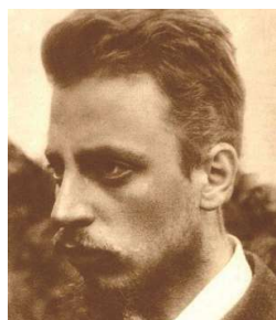
Rainer Maria Rilke